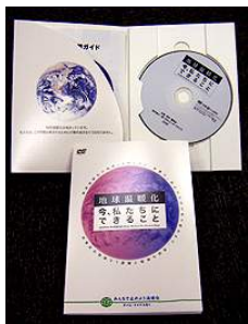
▲ DVD教材 今、私たちにできること