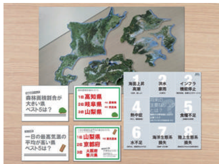
▲ A04-07 教えてニッポン!