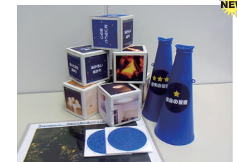
▲ E11 あかりいろいろ