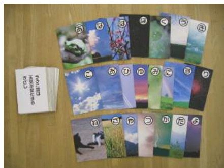
▲ E04 観天望気かるた