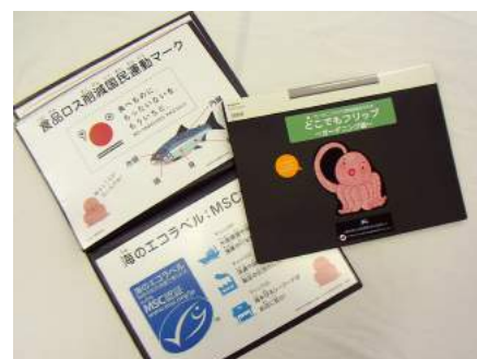
▲ E10 食とガーデニングから気候変動を考える「どこでもフリップ」