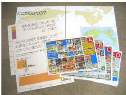
▲ A07-03 食べ物をめぐる物語