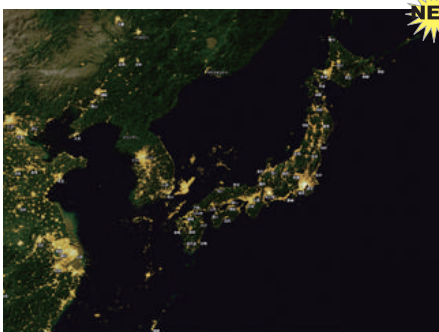
▲ A04-08 夜の日本~横断幕タペストリー~