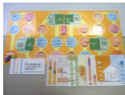
▲ Z-01 未来をつくろう!～社会とわたし～ (ステージ1)