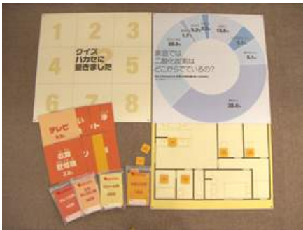
▲ A03-04 エコのタネをみつけよう