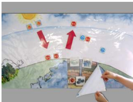
▲ A12-02 かくかくしかじかおんだんか～省スペース版～