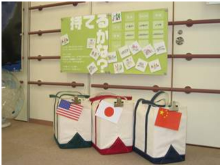
▲ A02-01 持てるかな? ~エネルギーのかばん~