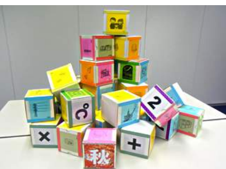
▲ E09 〇〇（まるまる）ボックス