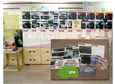
▲ A14-01 未来は変えられる