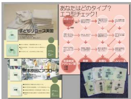
▲ A18-01 僕らの未来基準～マイ☆アレンジ～