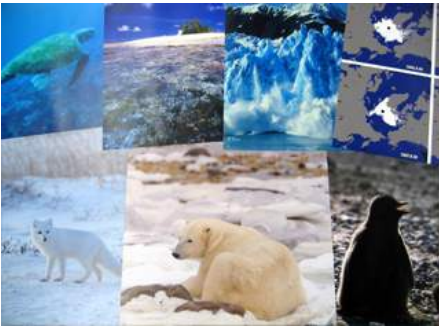
▲ A01-02 敏感な私たち