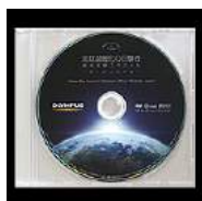
▲ DVD教材-岩合光昭スペシャル